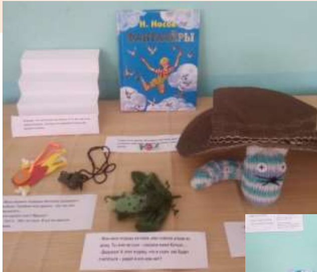
Музей проживания книги «Рассказы Н.Носова»