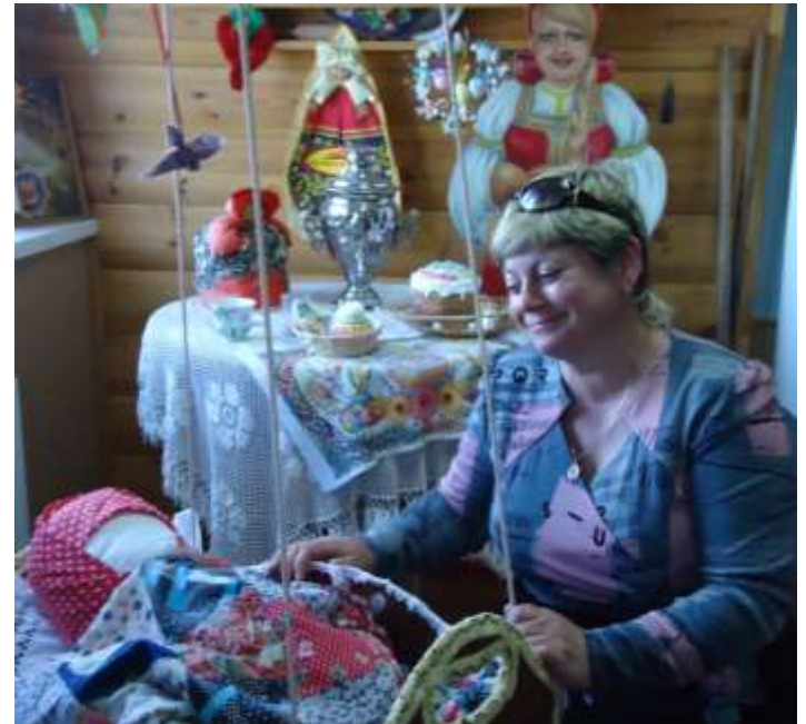
Педагогический стаж – 33 года

Единственный способ делать великие дела – ЛЮБИТЬ ТО, ЧТО ВЫ ДЕЛАЕТЕ.