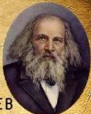
Д.И. МЕНДЕЛЕЕВ (учёный)

Вся гордость учителя в учениках, в росте посеянных им семян.